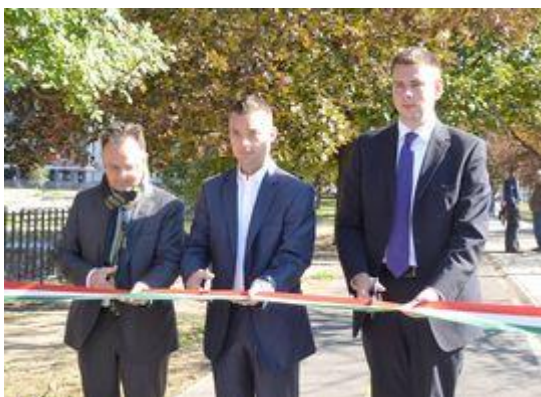
Budapesti Közlekedési Központ vezérigazgatója.

Befejeződtek a III. kerületi Bécsi út - Nagyszombat utcai kerékpárút munkálatai. Az Új Széchenyi terv keretében, európai uniós forrásból megépült kerékpárút- szakasz megvalósítója a Budapesti Közlekedési Központ, a projekt kedvezményezettje Budapest Főváros Önkormányzata. Budapest Főváros Önkormányzata és a Budapesti Közlekedési Központ európai uniós támogatással, az Új Széchenyi Terv forrásaiból megvalósult projekt eredményeként, 2,2 km hosszú kerékpáros útvonalat adott át a III. kerület, Bécsi út és Nagyszombat utca mentén. Az új szakaszt csütörtök délelőtt avatta fel dr. Szeneczey Balázs főpolgármester-helyettes és Vitézy Dávid, a